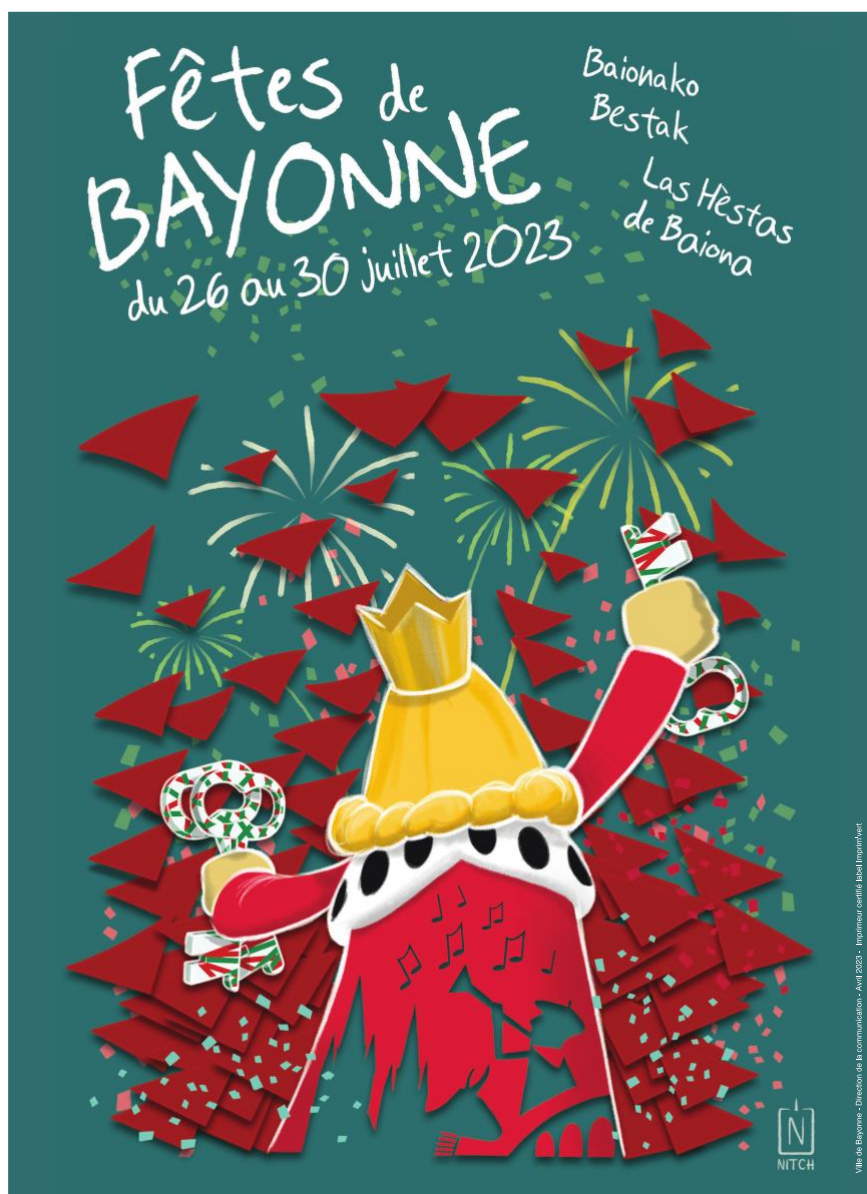
Nitch a réalisé l'affiche des Fêtes de Bayonne 2023.